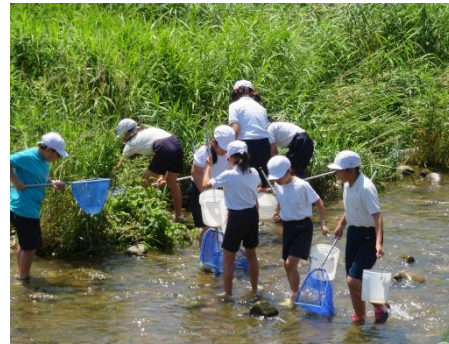
<5年 カワゲラウォッチング>