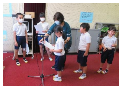
<対面式の放送の様子>

6月10日に、1年生と2年生以上の子供たちとの対面式を放送で行いました。本来なら4月早々に行う行事ですが、臨時休校があり、また全校が集まることができない状況であるため、放送で行うことになりました。はじめに、花の木執行部（児童会代表）の子が、学校の6つの宝（堂々発表・いつでも読書・笑顔の挨拶・ピカピカ掃除・元気な外遊び・自分で健康安全）について紹介しました。続いて、2年生以上の学年の代表が、1年生にお祝いのメッセージを述べました。最後に、1年生代表からもお礼のメッセージがあり、互いに顔は見えなくても、言葉を通して温かい心が通じ合う対面式となりました。分団登校や休み時間には、1年生を気遣う上級生の姿が見られます。1年生も、自分の力でいろいろなことができるようになってきています。学年を超えていい仲間関係づくりができてきていることをうれしく思っています。