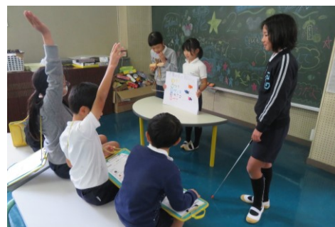
＜花の木行事での一場面＞

当日の活動では、3年生でも難しい漢字をすらすらと読み、回ってきたお客さんに説明したり解説したりする姿が見られました。また、廊下で一人受付に座り、カードにシールを貼る1年生の子の姿も見られました。高学年の子は、低学年の子が役割を果たせるようにやさしく援助していました。自分に与えられた役割をきちんと果たそうと準備したり練習したりしたこと、みんなで協力できたことが、当日の活動の成功につながりました。