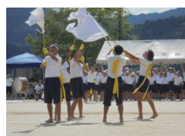
< 今年の運動会の様子 >

2学期最初の大きな行事は運動会です。スローガンには、「みんなの力で」「全力」「協力」という言葉が入っています。赤も白もめざす団の姿や応援の姿を明確にし、そのために一人一人が目標をもって全力で取り組んでほしいと思います。勝敗はつきませんが、全力で協力して取り組めれば、勝敗以上の感動や宝物を得られるものと思います。