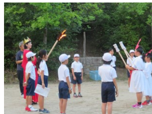
<5年地球村での合宿>

5年生は地球村宿泊体験学習で、仲間と一緒に生活し行動する学習をしました。次に何をするのか考え、自分から動いて行動することの意義やすばらしさを感じることができました。6年生は修学旅行で、グループで計画し行動する学習をしました。時間を意識しながら協力して計画通り行動することの大切さを学習しました。