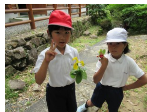
<1・2年竜吟の森探検>

1・2年生は、ペアを組み、一緒に活動する機会がたくさんありました。2年生がお兄さんやお姉さんになって、1年生にやさしく教えたり世話をしたりする姿が見られました。1年生は2年生の言うことを素直に聞いて、協力して活動していました。ペア活動で、気持ちよく自分の役割を果たすことや協力することができました。