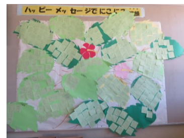
＜ハッピーメッセージ＞

子供が役割を果たしたことによって、みんなが困らないで生活がよりよくなった時、それをきちんと認め、価値づけることが大切です。「いつも〇〇さんが～をしてくれているから、みんなが困らないで生活できるね。」と声をかけたり、きちんと仕事をしたらシールを貼って認めたり、当番や日直に感謝の言葉を伝えて次の人と交代したりする等のことが、価値づけになっています。ハッピーメッセージも、価値づける一つの方法です。大人も子供も、自分が役割を果たしたことによってみんなが助かったりうれしく思ったりしたことがわかると、自己有用感を感じます。子供はそれを感じることで、次もみんなのためにがんばろうと思えます。逆に、何も価値づけがないと、ただやらされただけという思いになるかもしれません。集団と自分との係わりの中で、自己有用感を感じる機会が多ければ多いほど、自分は大切な人間なのだとは自覚できるようになります。そのことが、将来の夢・希望をもつことや自分は良いところがあるという思いをもたせることにつながります。そして、自己肯定感を高めることになります。自己有用感や自己肯定感とは、役割を果たしたことを認めるだけで高められるわけではありませんが、とても大事な手立てだと考えています。