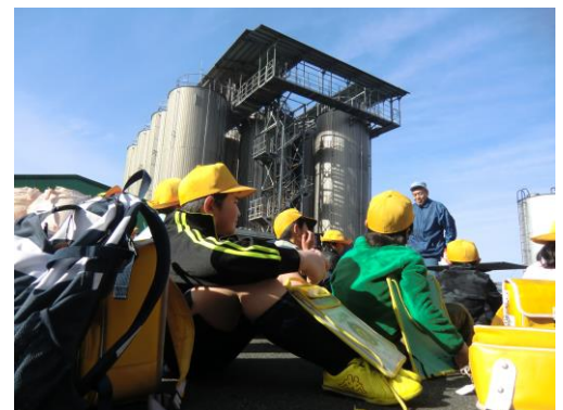
▲3年生醤油工場見学

3年生は、年間通じて大豆について学習を進めてきました。今回は武並町にある醤油工場を見学し、大豆から醤油をつくることについて学びました。