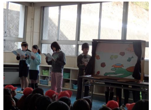
▲図書委員による大型紙芝居

今年度は2学期末には昨年度一年間の読書冊数を超えています。授業で図書館の本を活用していくこともしました。このような活動の成果で、今年度東濃地区図書館教育賞の優秀賞をいただくことができました。